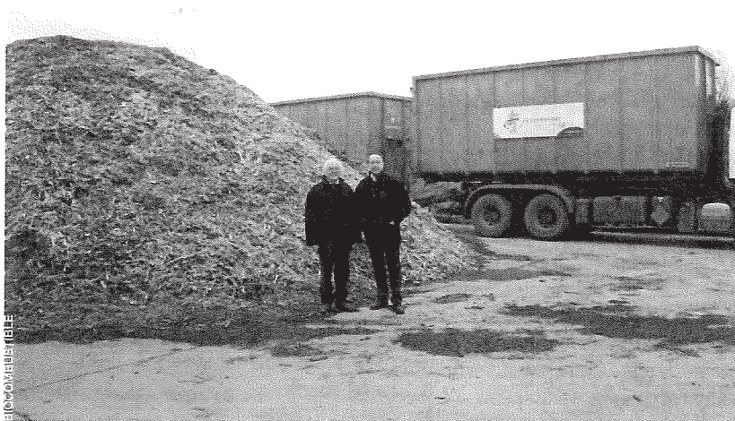
Biocombustible développe la filière bois énergie normande.

Des expériences qui en disent long sur la capacité de FBA à soutenir les projets, bien que les investisseurs soient parfaitement conscients qu'il existe un risque de perte en capital. Cet accompagnement dans la